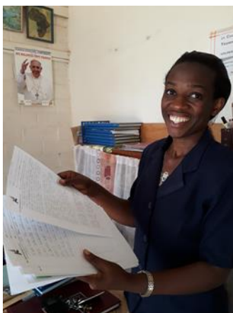
Kalungu: examens nakijken.

Gedurende de eerste drie maanden van 2021 mocht de hoogste klas van de lagere- en middelbare scholen open om zich voor te bereiden op hun examens (hier de Cito-toets en het eindexamen). De scholen bleven verder gesloten. Een haast onmogelijke klus, omdat al die andere maanden lesgeven onmogelijk bleek.