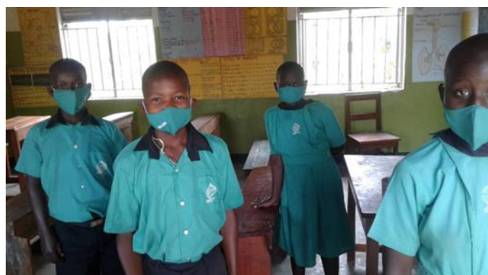
St. Charles: enkele examens leerlingen.