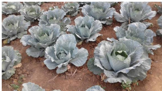
Resultaat o.a. kool.