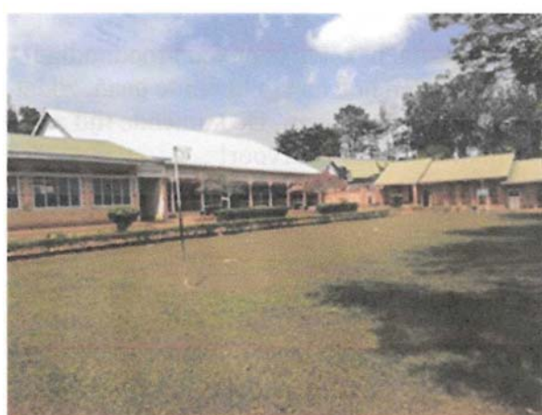
Rscj middelbare school in Kalungu.

Voortvloeiend uit het project "Mondiale Bewustwording" gestart in 2018 is er met leerlingen van het Knippenberg College in Helmond in januari 2020 een digitale uitwisseling gestart met leerlingen van de Secondary school van RSCJ in Kalungu. Op deze manier kunnen leeftijdgenoten en ook docenten met elkaar van gedachten wisselen en kennis van elkaars cultuur nemen. Door de lock-down aan beide zijden werd dit onmogelijk. In het komend schooljaar 2023 wordt dit contact weer hervat.