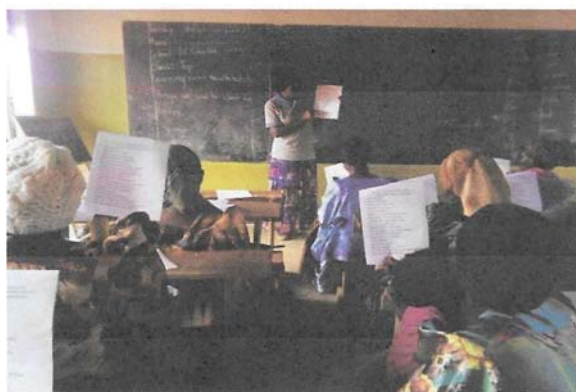
Vrouwen volgen op St. Charles hun lessen.

De bekostiging van materialen en het financieren van docenten, zoals voor een broodnodige financiële module, waarin cursisten wegwijs gemaakt worden hoe met geld om te gaan, zodat ze beter beslagen op de arbeidsmarkt komen, is daarmee een probleem. De komende tijd zal de hulp van sponsoren zeker nodig zijn. De vrouwen zijn u dankbaar daarvoor!