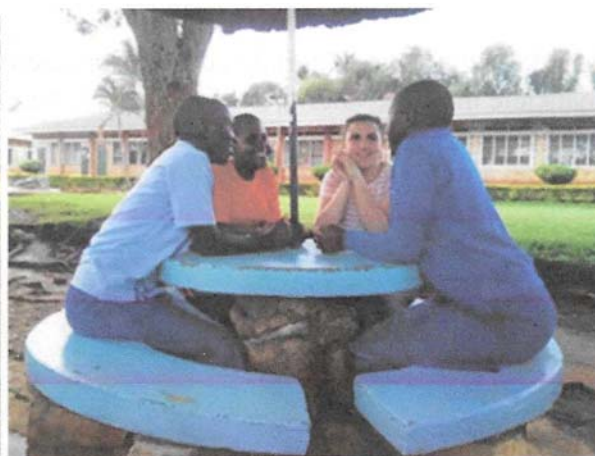
Werkbezoek Helmondse leerlingen aan Kalungu.